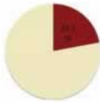
2017年数字经济贡献就业人数比例

• 2017年中国数字经济规模达到27.2万亿元人民币； • 同比增长达到20.3%；