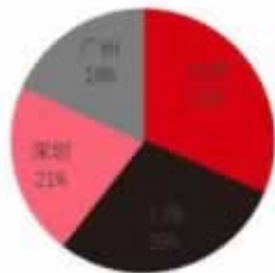
图 9：一线城市 3 月地产投资占比

我们出黑工作室，无前期不收任何费用，提供你方法经验，帮助你早日挽回黑款，把损失降到至低，如果你账号余额还在号上，额度可以进行转换出款的方法很多，及时处理这个时候挽回的几率也很大，了解更多成功出方法经验，空间采取，不收任何前期给你提供方法经验，早日挽回不必要损失被黑了不要和网站方客服吵，你就算吵赢了也没用，把人家吵烦了直接冻结你的账号那就得不偿失了。