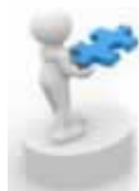
股权投资基金的权利保障—拖售权、回购权与股权锁定

网络平台出现如何拿回被黑的钱告诉你如何解决网络平台的风险，需要远离。2022年2月18日，我来告诉你被黑后如何取钱。