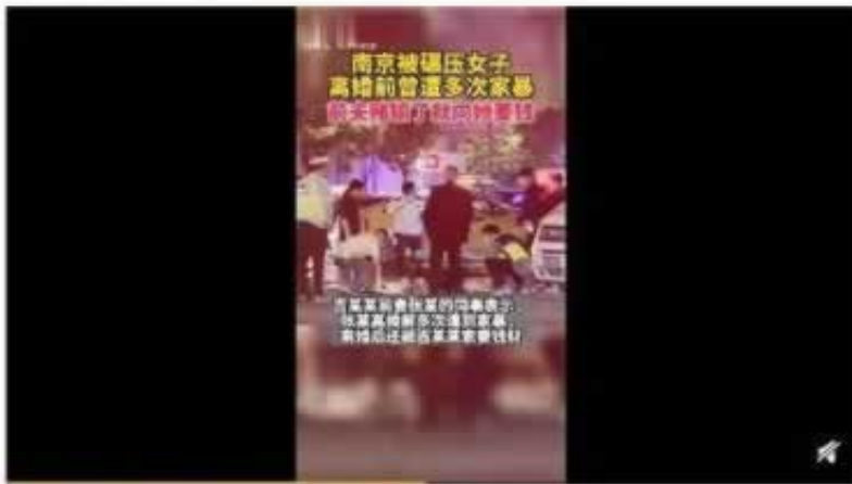
05月30日 21:31 来自 微博视频号

找有能力的出黑团队，帮你解决，联络方式文章底部网上如何辨别王头真假平台，下面来告诉你说到这个话题，我自己都倍感心痛和惋惜。