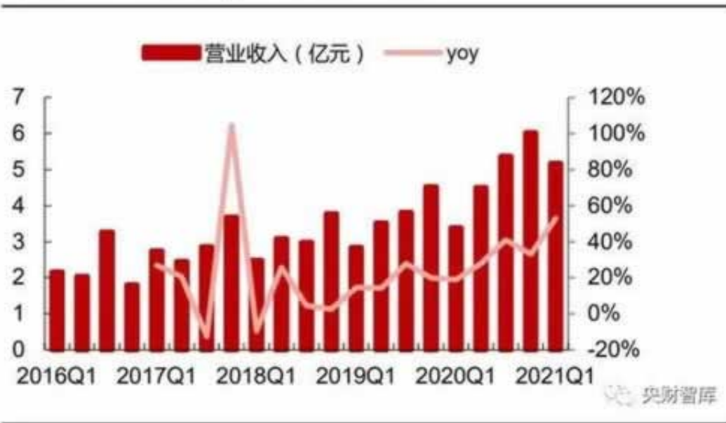
图 82：百润股份逐季收入稳且快的增长

在网上必须时刻注意防骗，不要轻易相信人，这样才能很好避免出现网络平台上被骗的情况。