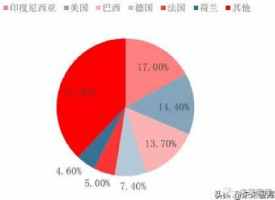
图 11：2020 年全球生物柴油产量分布

果你碰到的平台提示说注单异常需要审核才能体现的时候，这些都是平台的障眼法的，特别是超过3个小时还不能出款的话，那么后出的几率还是非常少的，因为他们觉得你是没有什么价值了，或者是盈利太多了，平台肯定就会限制你的，所以可以通过一些技术来赢钱赢的分，然后平台以为你输了，那么就会给你出的，所以这个技术我们是用来操作的，有些人担心不能提款到不了自己卡，其实这个是多余的，以为卡是改不了，所以找我们就不用担心这个，我们是帮你解决，不是黑平台要黑你的钱，被黑自己解决不了就找我们。