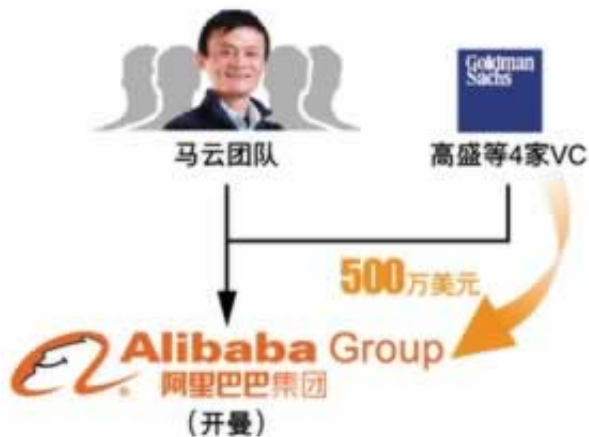
图4：阿里巴巴第一轮融资