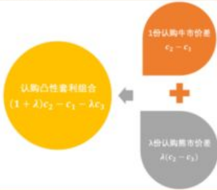
图 47：认购凸性套利组合拆分