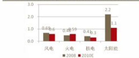
图表 27: 广东地区不同能源发电成本比较 (元/度电)