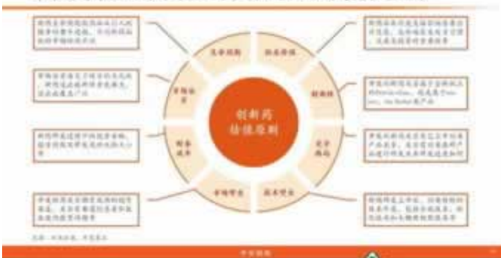
未来将有未盈利创新药企上市，其估值方法需考虑多重元素

答：网上赢钱提取失败提示注单异常，网上很多人因为不懂，被很多黑网华丽的外表所欺骗，其实没经历过是真的不会以为是黑网，看上去高端大气上档次，换做是我也可能会被骗，虽然看上去高端大气上档次，背后真的让人很心酸，输了钱你看不出破绽，等你赢钱了提款的时候更是心酸，客服就会跟你说些，什么违规下注，系统维护审核之类，对你进行各种忽悠让你提不出来款。