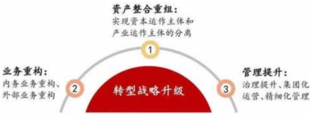
图 11 国有企业提质增效运作思路