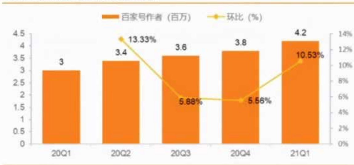
图 11: 百度百家号作者数 (百万) 及环比增速