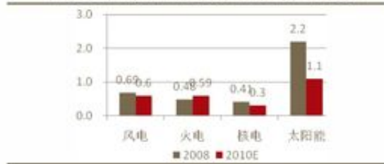
图表 27: 广东地区不同能源发电成本比较 (元/度电)