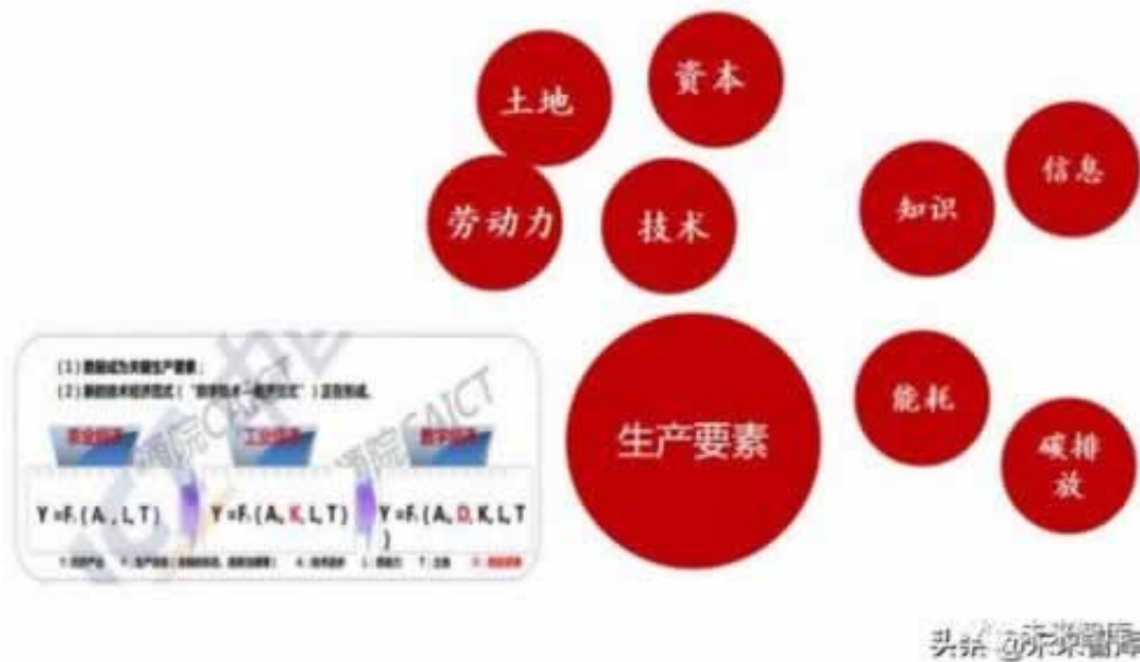
图 2：重构生产要素体系是经济转型升级的基础

网上系统审核提现失败，，解决办法希望大家能减少损失：可以找平台理论，询问平台是怎么回事，如果是暂时的那么就是没用问题的，如果平台搞各种理由不给出款，那么我们就只能找其他途径。