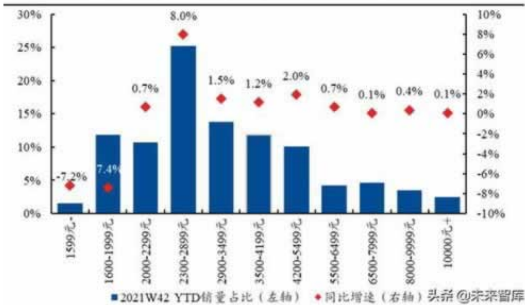
图 38、2021 年空调线下中端产品销量占比增加