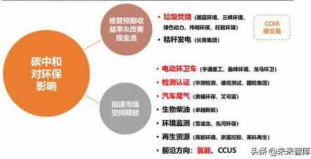
图 11: 碳中和带来的环保投资逻辑

我们在网上玩的时候，出现网上赢钱被黑怎么办，出现这种情况很多时候都是一些虚假平台，才会导致账号亏损情况出现，如果你还不知道怎么办，怎么去处理异常情况不给出款问题，现在已经专门解决这种问题的专业人士，在也不用担心自己的辛苦钱一分都要不回来了，只要我们通过正当渠道进行维权，一定有希望的，大家可以好好看看下面的解决办法，等帮助你快速出款。