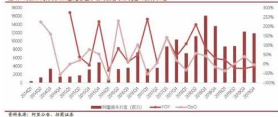
图 1: 阿里云大力投入云基建有望带动阿里资本开支重回上升轨道

在工作中的这段时间内，我确实认为自身早已戒除了，还劝告别的朋友们别堵，在我神气十足觉得打工挣确实能上岸时，实际狠狠地给了我一记耳光。