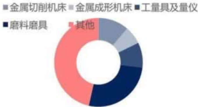
图 57: 中国工业各子行业销售占比 (2020 年)

小编也期待如果你仍在网堵，那麽现如今回家回去吧，你的家人要你，你能努力的工作上，你可以慢慢地还款，很多人在家里等着你。