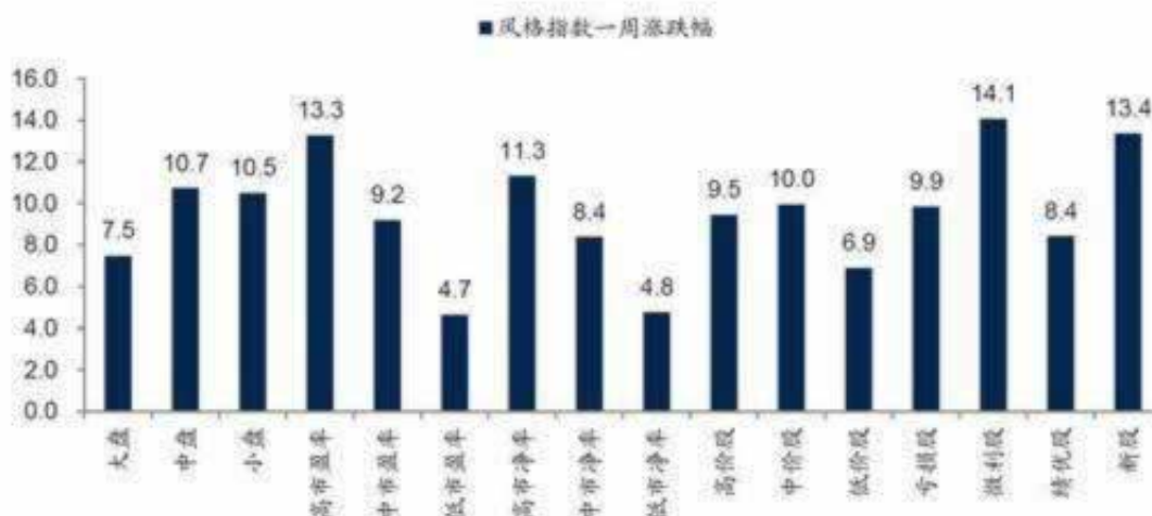
图 6: 主要风格指数过去一周涨跌幅概览