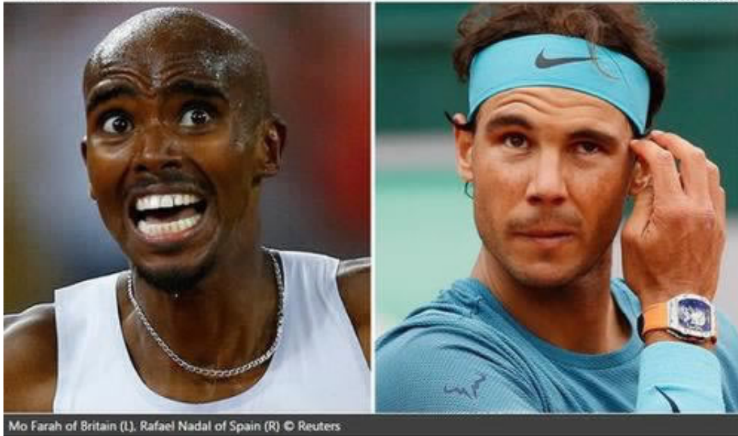
Mo Farah of Britain (L). Rafael Nadal of Spain (R)

多人还真不知道怎么解决的话，特别是好几天不给出了，很多时候都想放弃了，但是又舍不得，现在又一个好消息告诉你，就是网上注单异常，流水不足，那么完全是可以通过藏分技术解决，当天有结果，2天左右就能出完，当然这个藏分技术只有专业技术人员才知道的，一般人是不懂的，想找这方面解决办法，就咨询我们就可以了，我们将为您提供最新的解决方案。