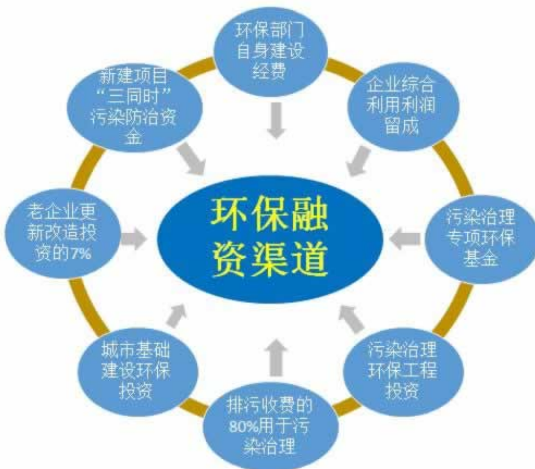
图3 我国传统环保融资渠道

在黑网赢钱出现注单异常一直不能提款，当你出现这种情况是不是有想放弃过，其实个人还是碰到这种情况还是非常无助的，特别是金额大的时候，那压力是非常大的，很多都是我们辛苦挣的钱，如果当初没接触这种，也就不会出现这种情况，那么现在说这些也是没用的，最关键的是赶紧解决的，避免出现被黑不能出款的问题，出现了就要去面对，在黑网赢钱下面一起来看看这种情况要怎么解决好。