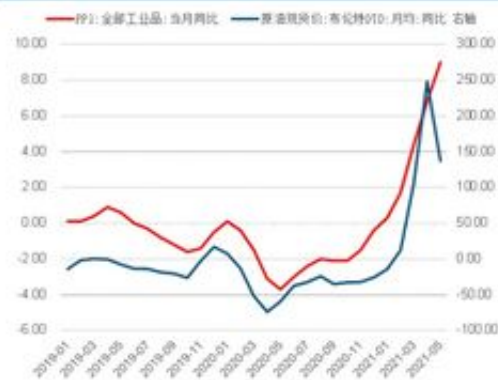
图 22: PPI 同比与原油价格同比 1,2