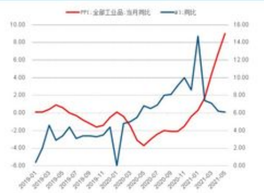
图 23: PPI 同比与 M1 同比 1,2