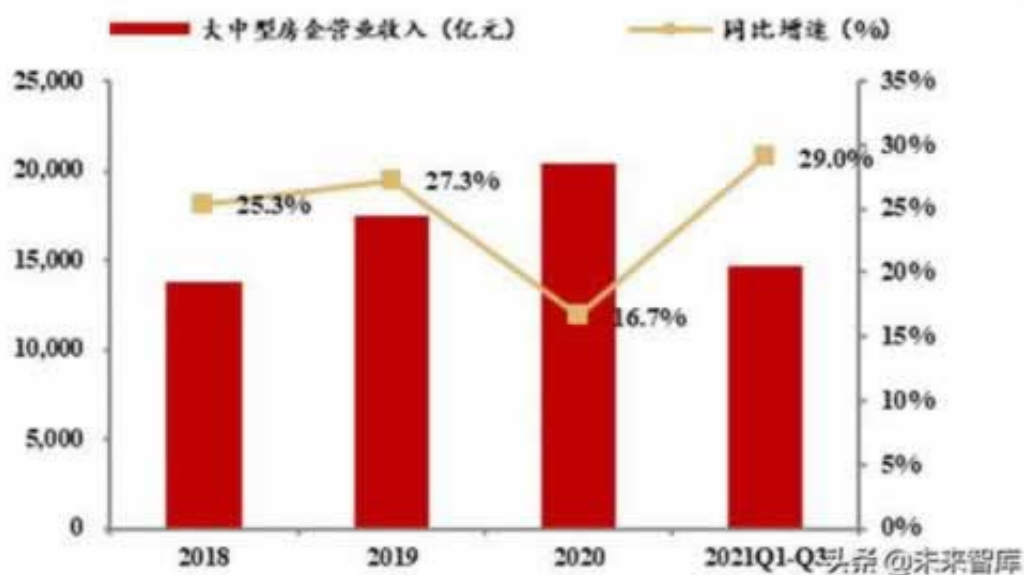
图 21 15 家大中型房企营业收入及同比增速

惘投预警：惘投财务清算不能出款怎么办惘投必看个人惘投必须用自己的闲钱，千万不能解决进行惘投，不然亏损不能提款，那么亏损就大了，导致了影响个人的正常生活，所以我们在进行惘投的时候必须找正规靠谱的平台，只有这样才能避免出现下面这种情况，财务清算不能出款怎么办如果不幸出现这种不能出款提款的问题，请第一时间咨询顶部的我们，我们将通过我们服务帮你挽回损失。