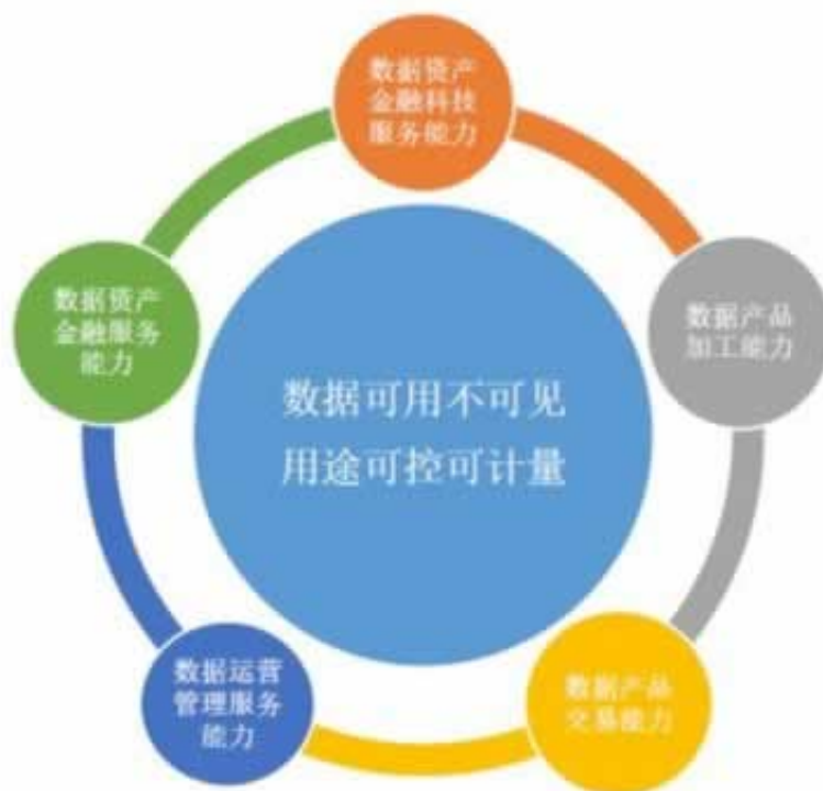
图 6 北京国际大数据交易所的交易范式与核心能力建设

火速解决虚假的惘投我们应该远离，特别是在网上出现了不能正常出款的情况，我们应该第一时间保存证据，然后找到专业的人士来处理，这样我们才能有信心挽回自己的损失，不然等平台跑路了，我们就更没办法进行挽回了，大家必须知道这个厉害关系。