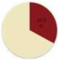
2017年数字经济占中国GDP比例