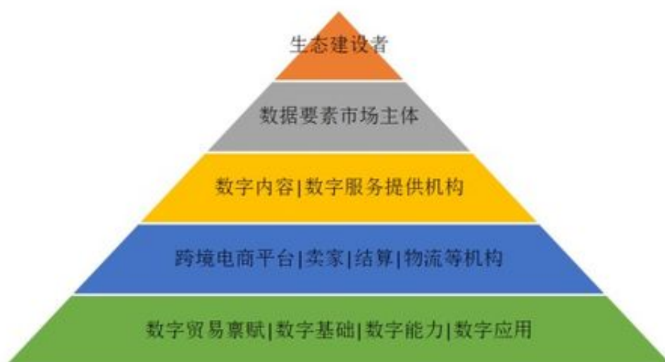
图3 完整的数字贸易生态

只有冷静下来我们才能采取措施找对方法，挽回自己的损失，我们冷静下来找他们的平台客服，去了解为什么会出现这种情况，想要解决问题我们首先得了解问题的本质的，在这期间不能着急的，聊天记录是至基础的证据，因为这类证据能够充分反映我们受骗者受骗的整个过程，相关分析师或代理商在聊天记录与分析师或代理商在聊天记录中得到充分反映。