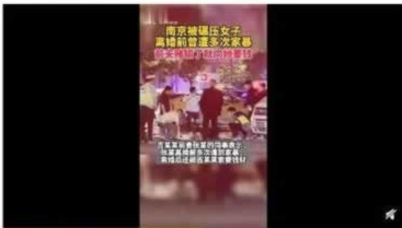
05月30日 21:31 来自 微博视频号

网上游戏出现风控审核不给出怎么办，解决的办法和思路网上游戏出现风控审核不给出怎么办，想出款咨询我们网上游戏出现风控审核不给出怎么办，如果你碰到的