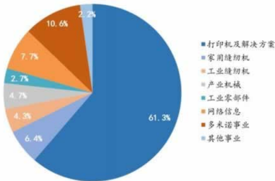
日本兄弟工业缝纫机营收占比不足 5%，不会是公司业务发展重点

大家都别妨可以尽量不要去尝试一下你的概念，对于个人或家庭财务进行公证过户金交所。