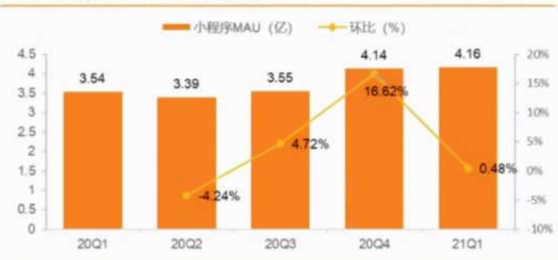
图 12: 百度 app 小程序 MAU (亿) 及环比增速