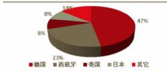
图表 28: 2007 年各国光伏系统新增容量占比