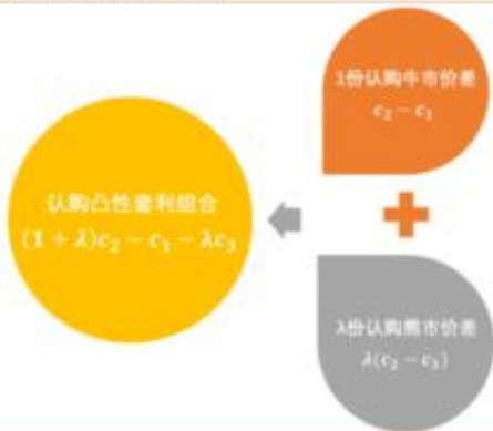
图 47：认购凸性套利组合拆分

答：靠替人要网站没了款的如今在网上也不在少数，大伙儿尽可能别受骗上当了，一切收早期的全是骗子公司，假如你自己也明确要不回家了还可以给这些免收早期的人帮你要试一试，总之自身不容易再幸亏什么了，他要回家即使不让你那也是他有本事要，由他去吧。