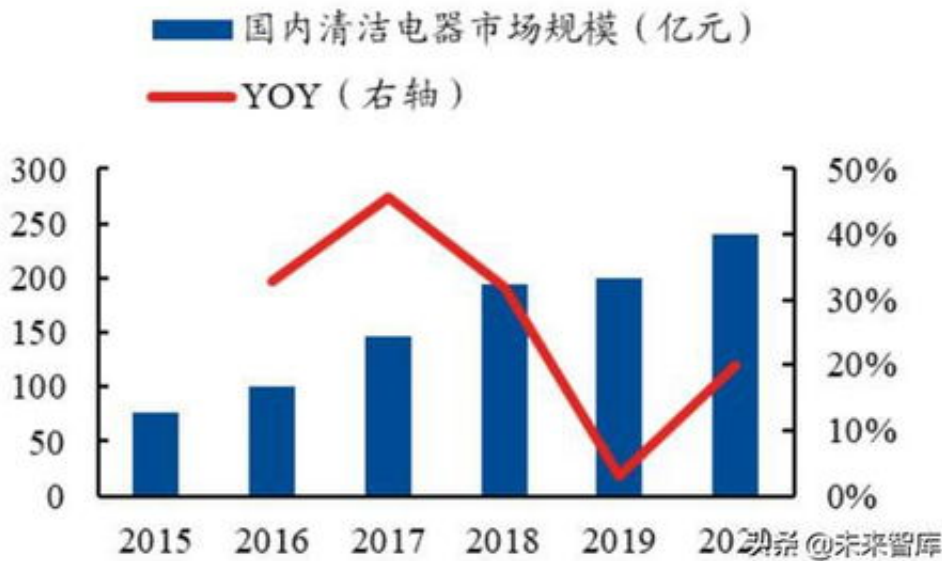
图 60、2015 至今中国清洁电器零售额情况

步骤，也就是找客服询问，很多天不到账了，这时候我们还是要继续找客服反馈，当然还是要冷静应对，防止直接被网上营前平台拉黑，或者网上营前账号被封，这时候我们要做的就是跟平台理论，或者自己想办法来解决，如果理论没用，自己也没用解决的办法，那么就要进行步骤步骤，就是网上营前出现不能出款，不能提款的问题，这时候相信是可以明确平台是黑平台，找各种借口不给出款都是为了拖延你的，我们能做的就是赶紧保存证据，包括银行流水，账号密码，平台信息等，有