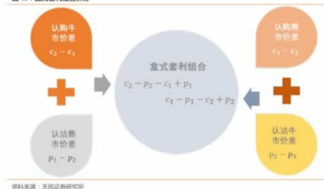
图 49：盒式套利组合拆分

出黑工作室来告诉你解决的办法和经验分享当我们出现这种黑网营前不能出款的时候，我们要知道面对这种情况的时候，我们要保持清醒头脑来应对这个时候，我们可以通过我们的技能来帮你解决好，让你快速出款。